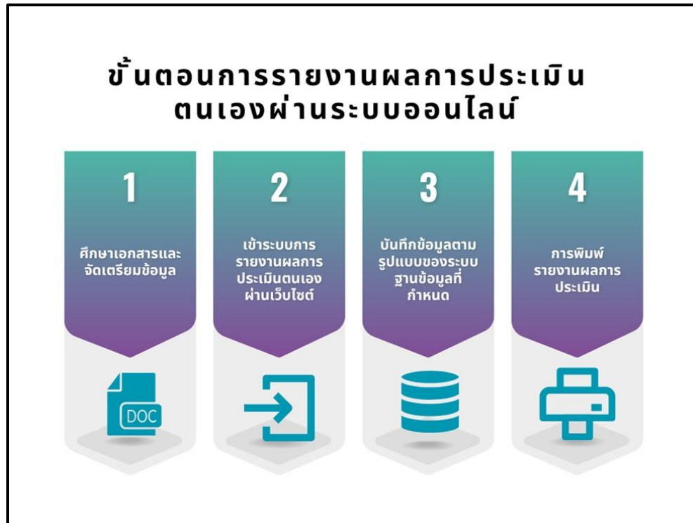
ภาพที่ 7.1 การรายงานผลการประเมินตนเองผ่านระบบออนไลน์