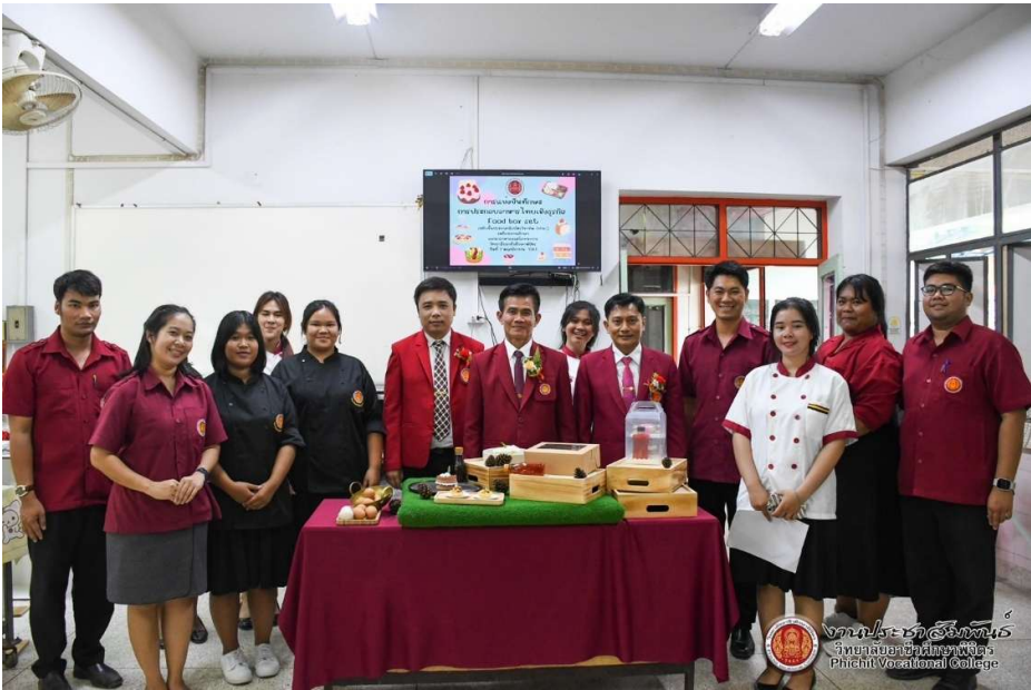
งานประเพณีสงกรานต์ วิทยาลัยอาชีวศึกษาพิจิตร Pichit Vocational College