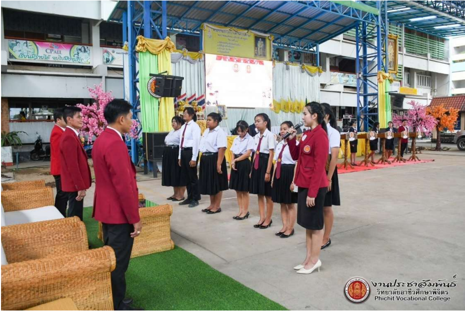
งานประเพณีสงกรานต์ วิทยาลัยอาชีวศึกษาพิจิตร Pichit Vocational College