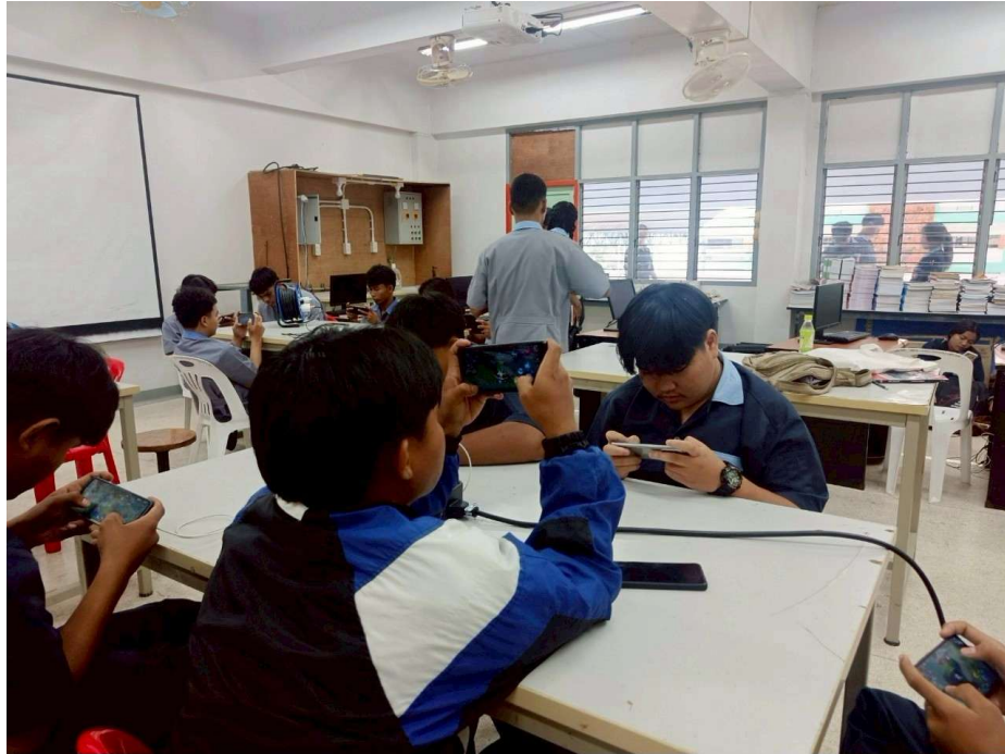
POVA 6 Pro 5G