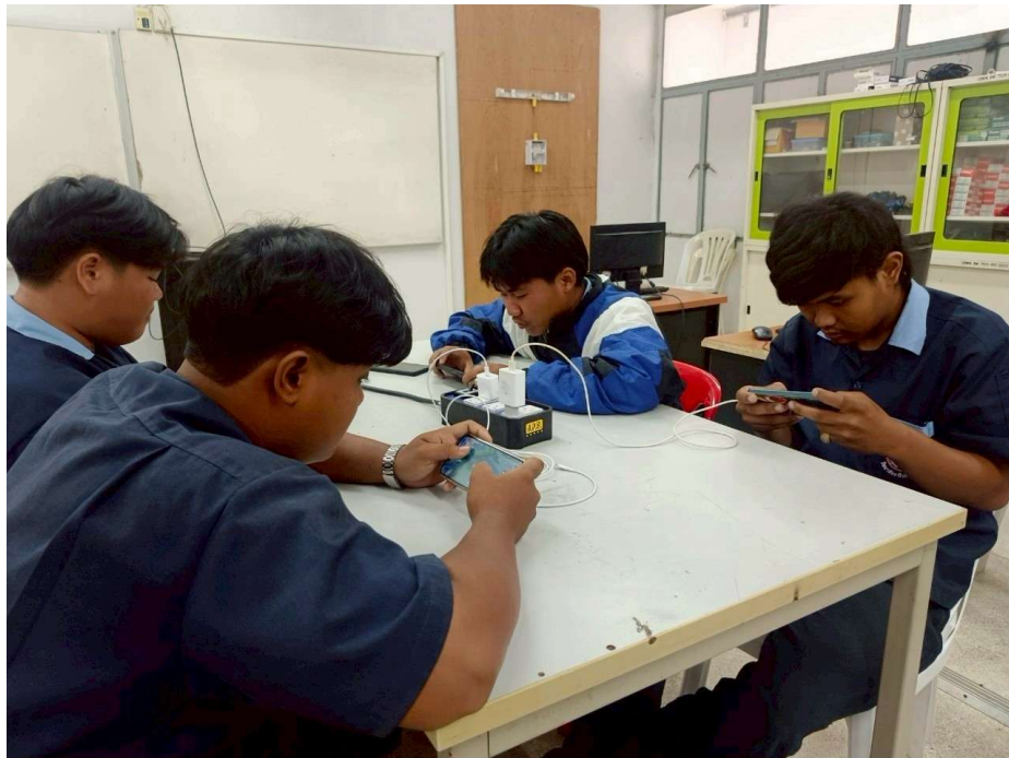
POVA 6 Pro 5G